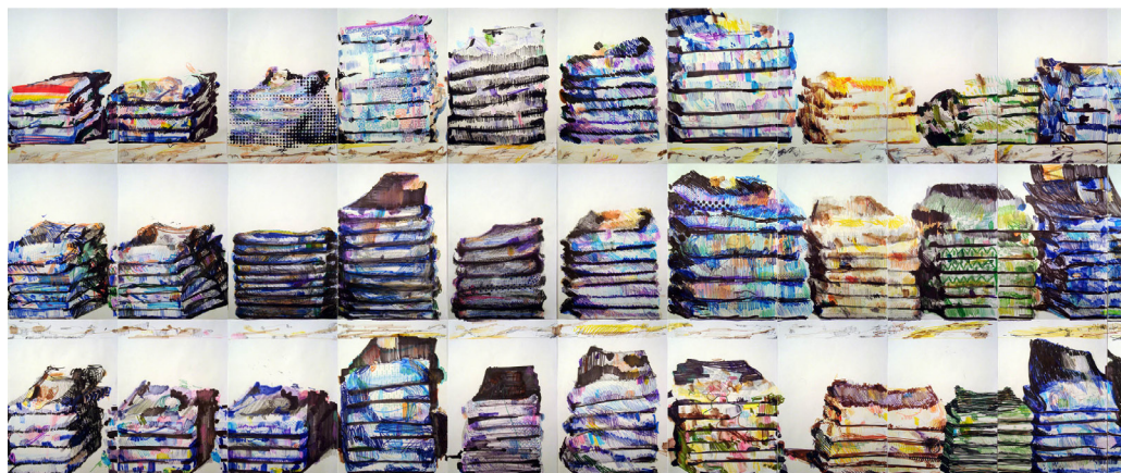
BestSeller V, 90x275 cm, 2013, Rotuladores, marcadores fluorescentes y lápices de colores sobre papel