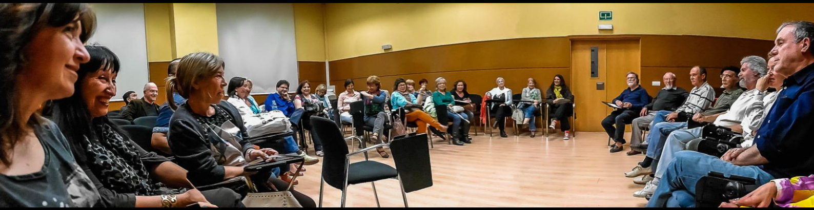
Encuentro en la Sede de la Universidad de Alicante