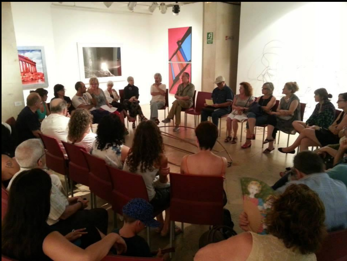
Encuentro en El Centro 14, Alicante